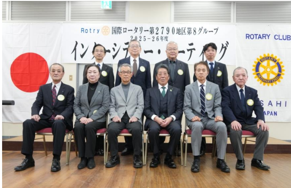
第8グループ インターシティー・ミーティング

銚子東ロータリークラブ Weekly Bulletin NO. 2573・2574