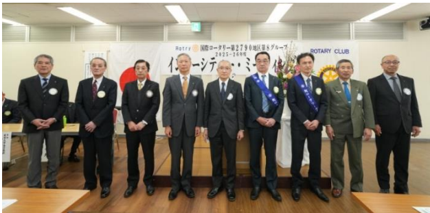
次年度会 AG ・ 補佐幹事 ・ 会長 ・ 幹事紹介